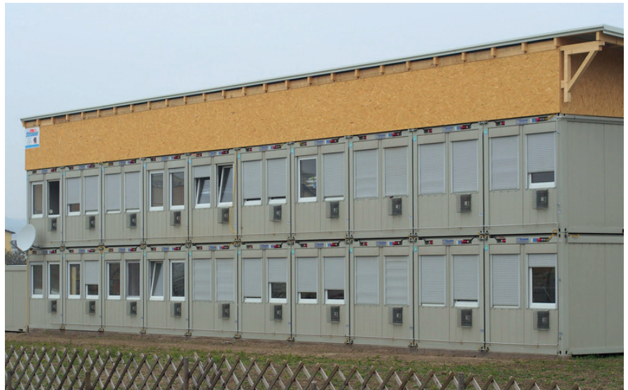
Containerbauten zur Flüchtlingsunterbringung.

In der Regel werden Mietverträge über Gemeinschaftsunterkünfte direkt zwischen Grundstückseigentümer und dem öffentlichen Träger geschlossen. Somit macht nur der Mietvertrag aus einer Immobilie eine Gemeinschaftsunterkunft für Flüchtlinge und Asylbegehrende. Dementsprechend wichtig ist die Analyse des Mietvertrags, um die daraus resultierenden Erträge und zu berücksichtigenden Kosten zu bestimmen. In der